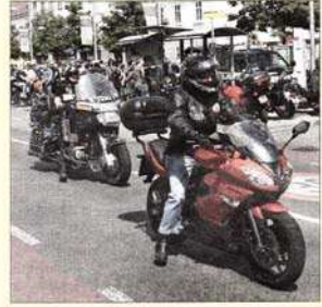
Links: Alle paar Minuten stießen neue Motorradfahrer zum Treffpunkt am Hauptplatz, wo insgesamt 221 Maschinen geparkt werden mussten: Ein neuer Teilnehmerrekord!