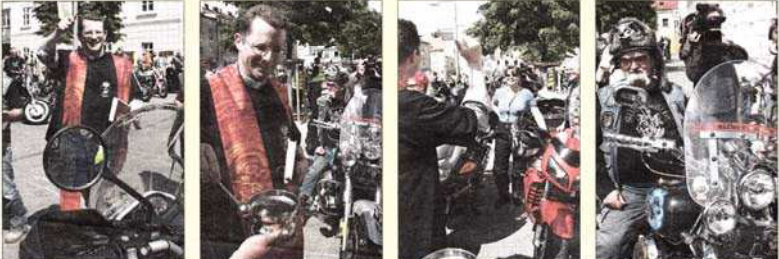
Oben: Nicht nur die Bikes wurden gesegnet, auch der NÖN-Fotograf und einige Biker bekamen einige Tropfen des gesegneten Wassers ab. Nach der Zeremonie machten sich die Biker auf den Weg zum Pfarrzentrum am Zirkelweg, um dem Gottesdienst beizuwohnen und zu feiern.

Weitere Fotos a. d. Clubhomepage, Facebook und Club PC